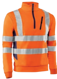
HV791 STRATOS Naranja flúor-Marino / Cor de laranja florescente-Azul marinho