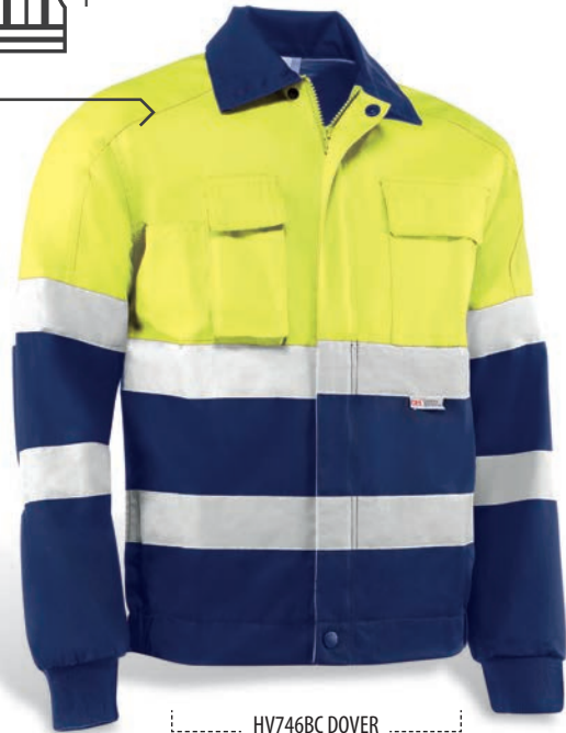
HV746BC DOVER Amarillo flúor-Marino / Amarelo fluorescente-Azul marinho