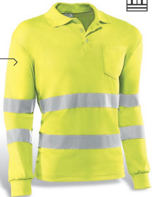
HV720ML GALES Amarillo flúor / Amarelo florescente