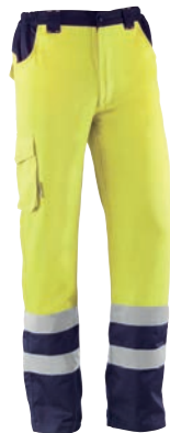
HV748BC DOVER Amarillo flúor-Marino Amarelo fluorescente -Azul marinho