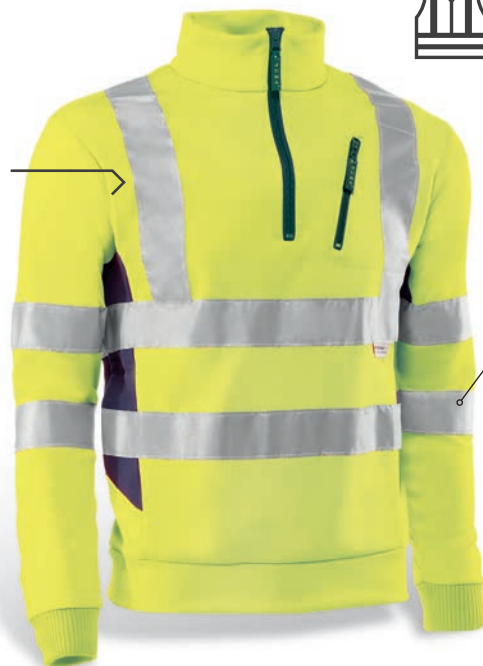
HV790 CARPATOS Amarillo flúor-Marino / Amarelo florescente-Azul marinho