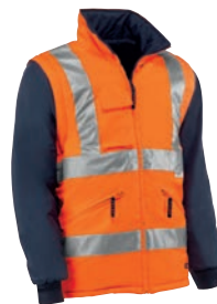
HV710 GALAXY Naranja flúor-Marino / Cor de laranja fluorescente-Azul marinho