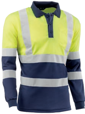
HV720BCMLT AZUL GALES Amarillo flúor-Marino / Amarelo fluorescente-Azul marinho