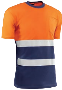
..... HV731BCAZUL EIRE ..... Naranja flúor-Marino / Cor de laranja fluorescente- Azul marinho