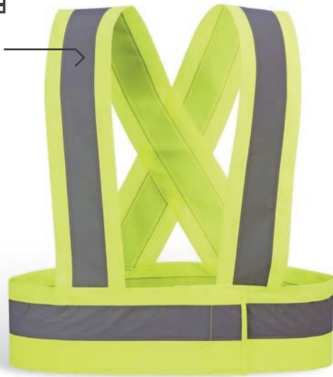
HVT STRAP Amarillo flúor / Amarelo florescente