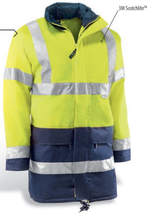
HV741 GLASGOW Amarillo flúor-Marino / Amarelo fluorescente-Azul marinho