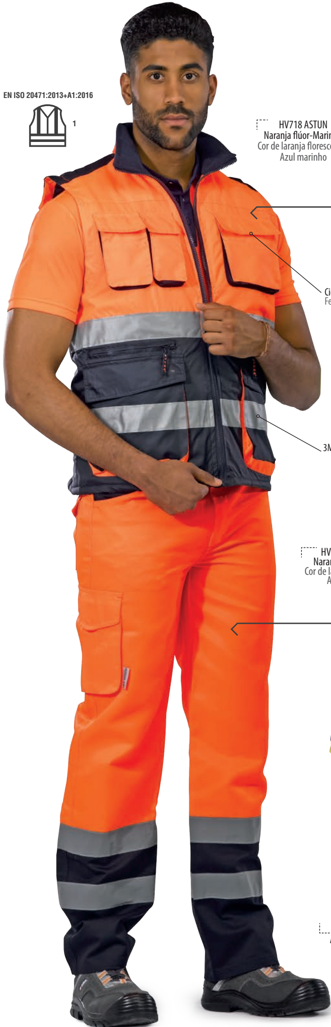
HV718 ASTUN Naranja flúor-Marino / Cor de laranja fluorescente- Azul marinho