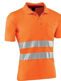
HV730 EIRE Naranja flúor / Cor de laranja florescente