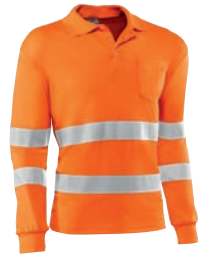
HV730ML EIRE Naranja flúor / Cor de laranja florescente