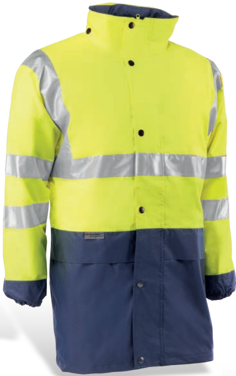
HV752 LAGON Amarillo flúor-Marino / Amarelo fluorescente-Azul marinho