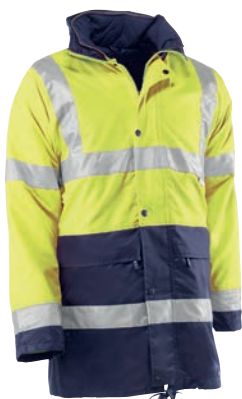
HV780 CHESTER Amarillo flúor-Marino / Amarelo fluorescente-Azul marinho

Parka desmontable con bandas de 3M® Scotchlite™. Dispone de dos bolsillos frontales y uno interior. Dispone en su interior de una chaqueta reversible con mangas desmontables, dispone de dos bolsillos y uno interior, con bandas reflectantes 3M® y puño elástico. Capucha interior fija con cierre de velcro. Cordón en la parte inferior para mayor ajuste.