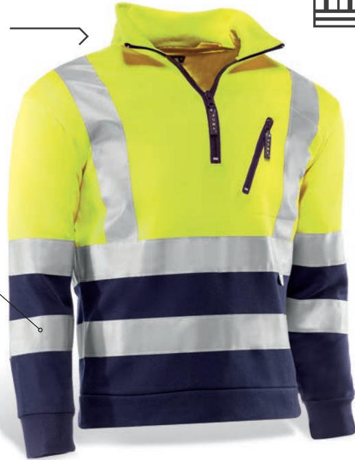
HV792 KENYA Amarillo flúor-Marino / Amarelo florescente-Azul marinho