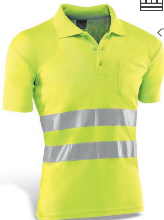
HV720 GALES Amarillo flúor / Amarelo florescente