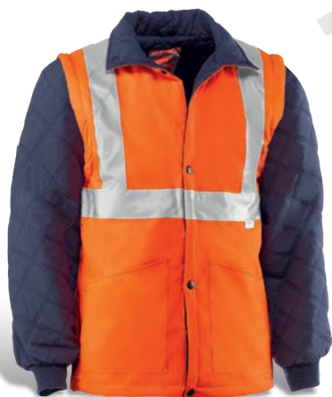
CHAQUETA REVERSIBLE / CASACO REVERSÍVEL