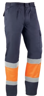
HV820 KARELIA Marino-Naranja flúor / Azul marinho-Cor de laranja fluorescente