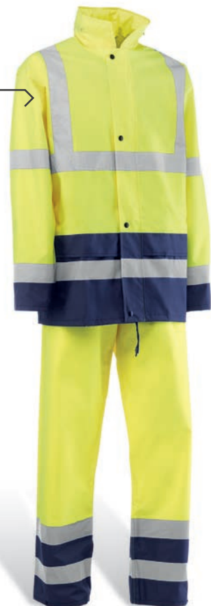
HV1752 NILO Amarillo flúor-Marino / Amarelo fluorescente-Azul marinho