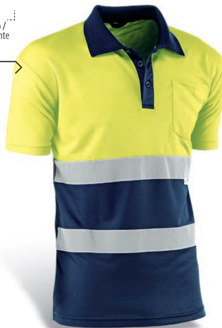
HV720BCAZUL GALES Amarillo flúor - Marino / Amarelo fluorescente-Azul marinho