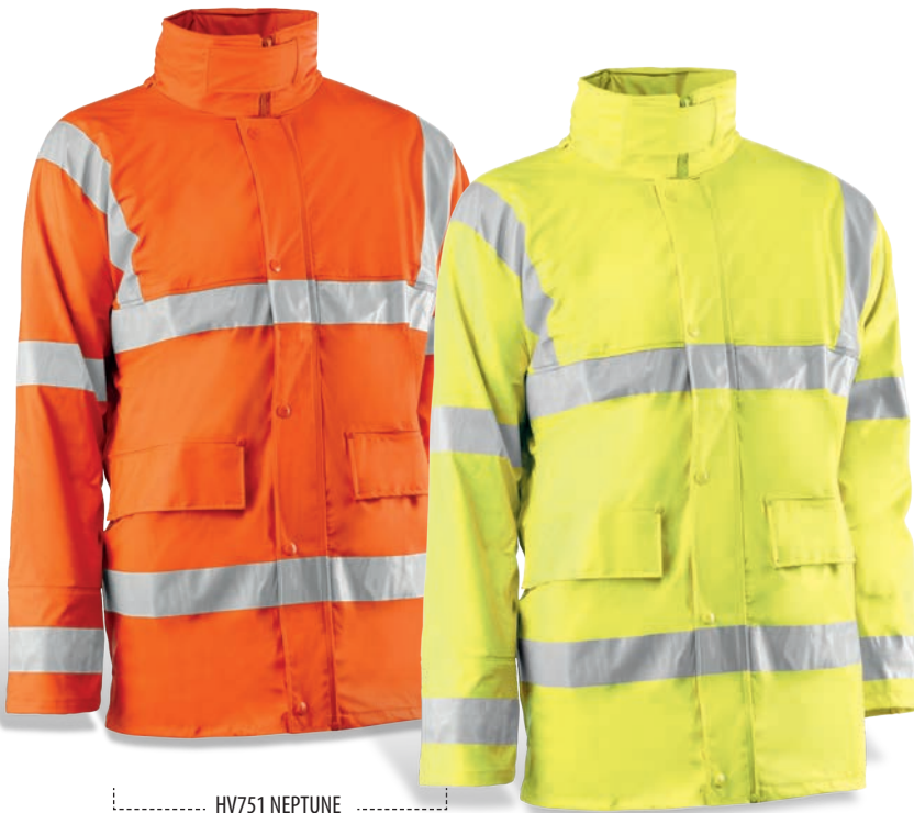
HV751 NEPTUNE Naranja flúor / Cor de laranja florescente