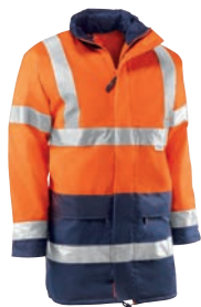
HV742 OXFORD Naranja flúor-Marino / Cor de laranja fluorescente- Azul marinho