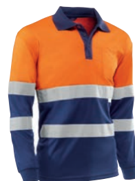
HV730BCMLAZUL EIRE Naranja flúor-Marino / Cor de laranja fluorescente-Azul marinho