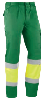
HV814 ITAKA Verde-Amarillo flúor / Verde-Amarelo fluorescente