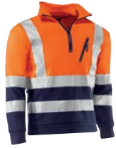
HV793 MITIKA Naranja flúor-Marino / Cor de laranja florescente- Azul marinho