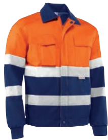
HV747BC DEVON Naranja flúor-Marino / Cor de laranja fluorescente-Azul marinho