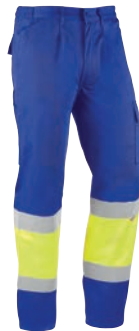
HV812 HYDRA Azulina-Amarillo flúor / Azulado-Amarelo fluorescente