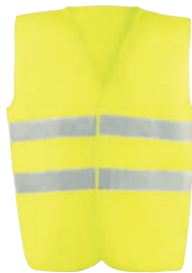
HV714YEL Amarillo flúor / Amarelo florescente