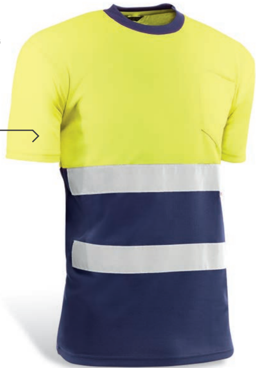
..... HV721BCAZUL GALES ..... Amarillo flúor-Marino / Amarelo fluorescente-Azul marinho