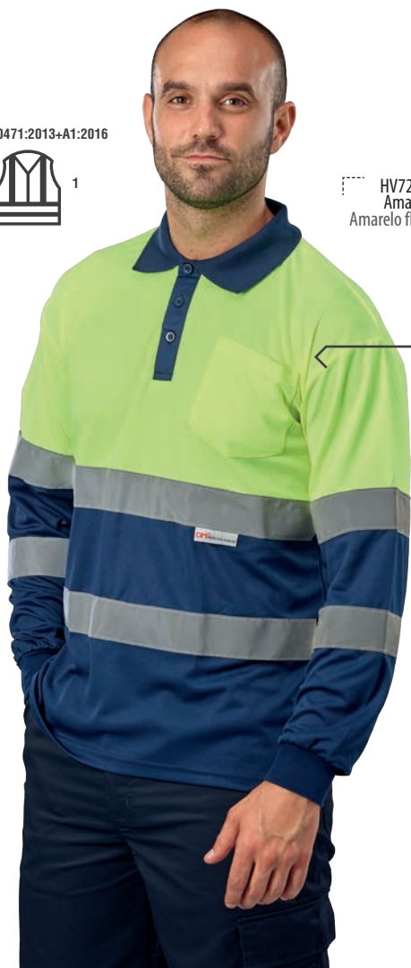
HV720BCMLAZUL GALES Amarillo flúor-Marino / Amarelo fluorescente-Azul marinho