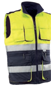
HV717 ELBRUS Amarillo flúor-Marino / Amarelo fluorescente-Azul marinho

Chaleco multibolsillos con bandas reflectantes de 3M® Scotchlite™. Dispone de tres bolsillos superiores con cierre velcro y tapeta y cuatro bolsillos inferiores.