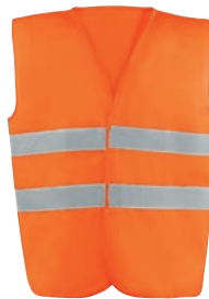
HV714ORA Naranja flúor / Cor de laranja florescente