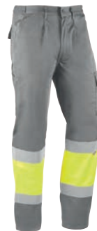
HV816 KYOTO Gris-Amarillo flúor / Cizento-Amarelo fluorescente