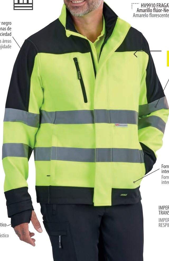
HV9910 FRAGATA Amarillo flúor-Negro / Amarelo fluorescente-Preto

Color negro en las zonas de mayor suciedad Preta nas áreas de maior sujidade