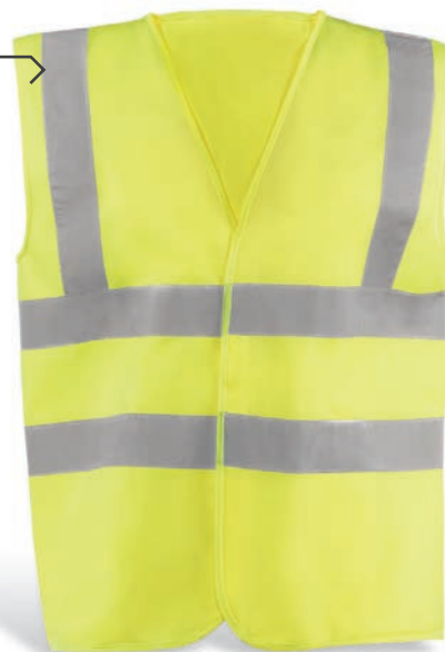
HV714TYEL Amarillo flúor / Amarelo florescente