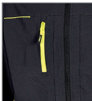
Bolsillo con cremallera para celular