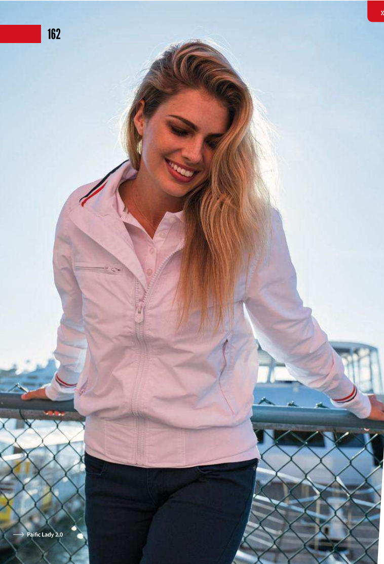
→ Pacific Lady 2.0