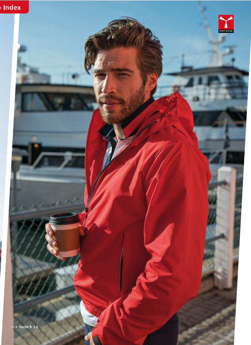
→ Pacific R. 2.0