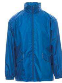
Azul real / Azul real