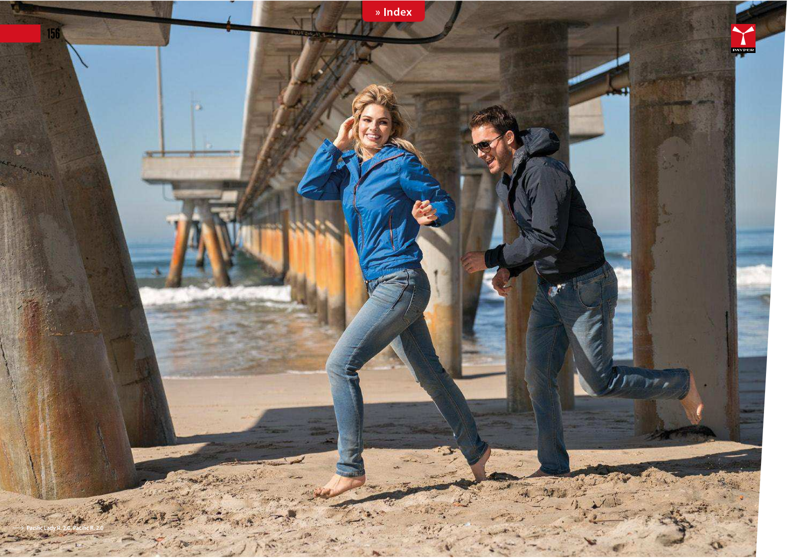
— Pacific Lady R. 2.0, Pacific R. 2.0