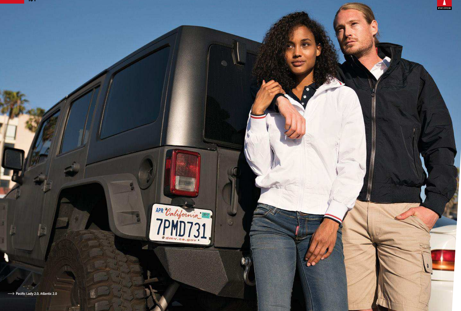
→ Pacific Lady 2.0, Atlantic 2.0