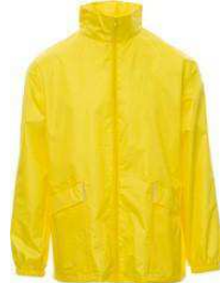
Amarillo / Amarelo