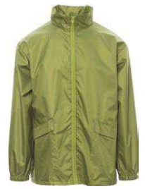
Verde ácido / Verde ácido