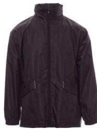
Negro / Preto