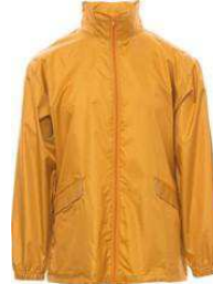
Naranja / Laranja