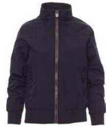
Azul marino / Azul marinho