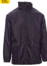
Azul marino / Azul marinho