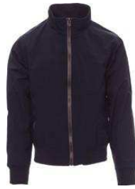
Azul marino / Azul marinho