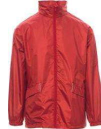
Rojo / Vermelho