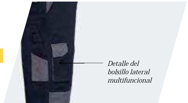
Detalle del bolsillo lateral multifuncional