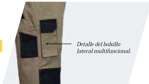
Detalle del bolsillo lateral multifuncional.