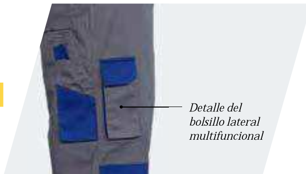
Detalle del bolsillo lateral multifuncional