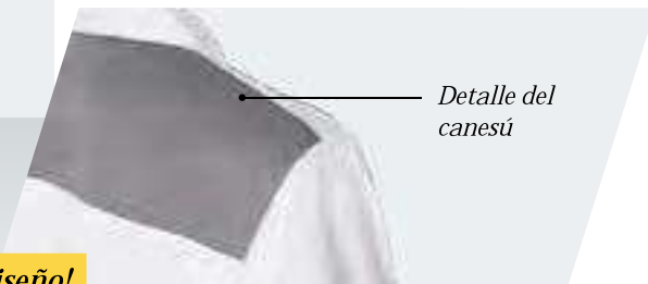
Detalle del canesú