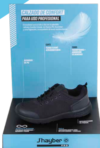
Expositor PRO 1 Pie ref. 99232-1