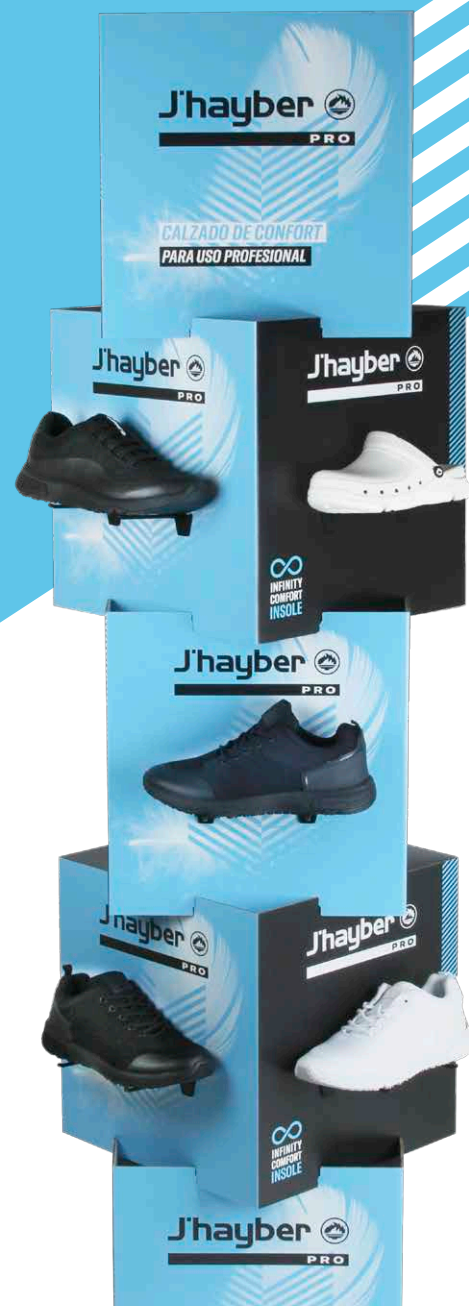
Expositor PRO 5 Pies ref. 99249-1