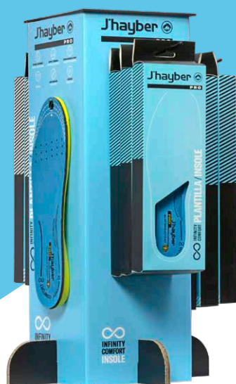
Expositor Plantilla PRO ref. 99248 -1