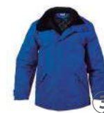
AZUL ROYAL ROYAL BLUE ROYAL BLEU ROYAL