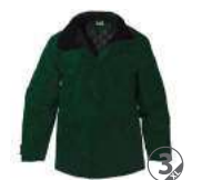
VERDE BOTELLA BOTTLE GREEN VERDE BOMBOLE VERT OLIVE