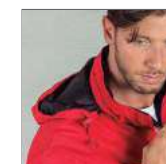
Capucha plegable en el cuello