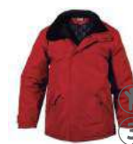
ROJO RED ROSSO ROUGE