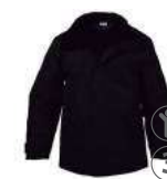
NEGRO BLACK NERO NOIR