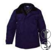
MARINO NAVY BLUE BLU MARINE BLEU MARINE