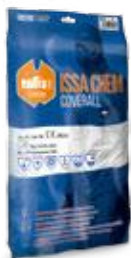
En bolsa para colgar