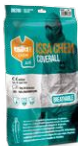
En bolsa para colgar