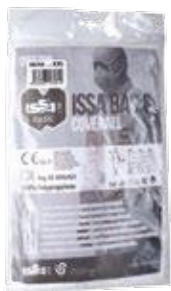
En bolsa para colgar