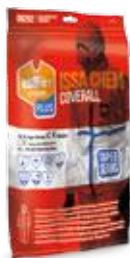
En bolsa para colgar