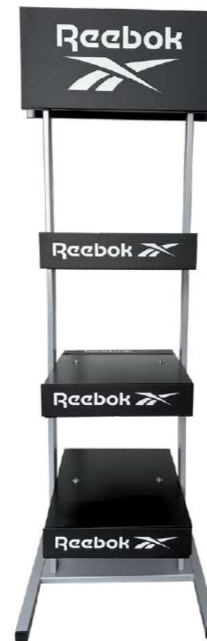
LOGO STAND RBSTAND Ecofriendly Display Dimensions: 50 cm x 160 cm x 50 cm