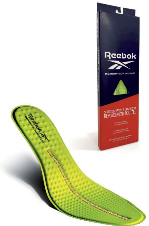
FOOTBED RBMT Removable Cushion Footbed for ESD and Conductive Footwear Fluorescent Green