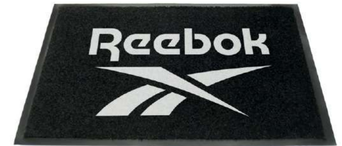
LOGO MAT RBMAT Dimensions: 60 cm x 90 cm