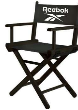
LOGO CHAIR RBCHAIR Dimensions: 49 cm x 72 cm x 34 cm